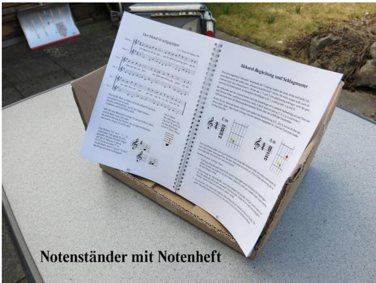
Notenständer mit Notenheft

Im Prinzip könnt Ihr jetzt schon Euren Tisch-Notenständer benutzen. Wenn Ihr ihn noch etwas edler haben wollt, lest weiter: